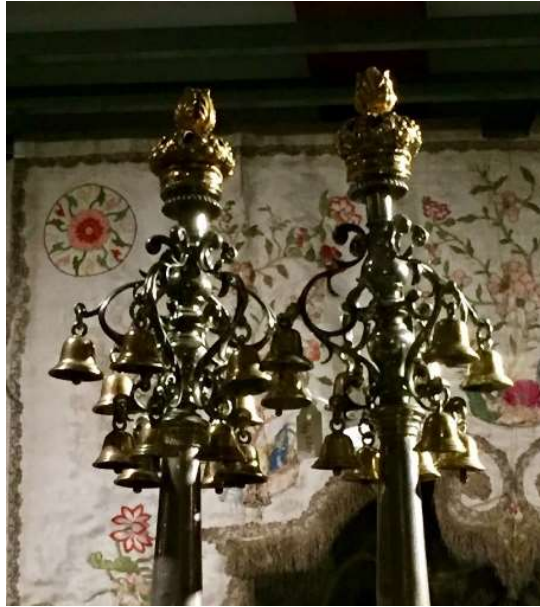
Chag Sameach Joodse muziek op carillon